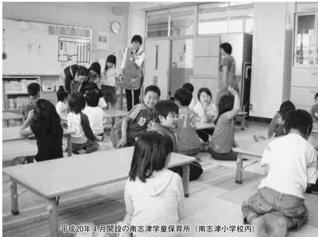
平成20年4月開設の南志津学童保育所（南志津小学校内）

発行 佐倉市議会 編集 議会報編集委員会 〒285-8501 佐倉市海隣寺町97番地 TEL484-6177 FAX486-2508 佐倉市ホームページ http://www.city.sakura.lg.jp メールアドレス gikai@city.sakura.lg.jp