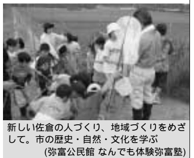
新しい佐倉の人づくり、地域づくりをめざして。市の歴史・自然・文化を学ぶ（弥富公民館 なんでも体験弥富塾）

答 中長期の視点に立った教育目標を明らかにし、これからの佐倉の教育の方向性、見通しを示すために佐倉教育ビジョンを策定した。これにより、佐倉の教育がより身近なものとして理解され、市民の参加、参画が推進されるとともに、本市の教育が充実し、