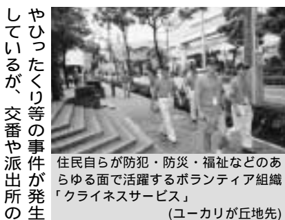
住民自らが防犯・防災・福祉などのあらゆる面で活躍するボランティア組織「クライネスサービス」（ユウカリが丘地先）

問 本年1月、臼井・千代田地区を対象とした特別養護老人ホーム設置事業者の公募があったが、3月31日付で募集が凍結され、応募事業者に通知された。この結果、建設が1年以上先送りされた。なぜ事業を凍結したのか。今後公募の結果をどうするのか。