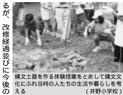
縄文土器を作る体験授業をおとして縄文文化にふれ当時の人たちの生活や暮らしを考える（井野小学校）

問 井野長割遺跡は縄文時代後期から晩期約3千500年から3千年前にかけての直径160メートルに達する全国でも最大規模の環状盛り土遺構で貴重な遺跡である。保全すべきと考えるがどうか。