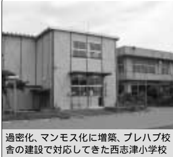
過密化、マンモス化に増築、プレハブ校舎の建設で対応してきた西志津小学校

答 交番や派出所は、事件事故の発生状況や、用地確保の問題、周辺の交番の位置関係等を勘案する中で、県公安委員会が設置を決めている。交番の設置について、佐倉警察署に要望しているが、近年市内では新たな設置は認められていない。防犯用監視カメラの住宅地域の設置は、市民のプライバシー保護の関係から、難しいとされている。当面、市民一人ひとりの防犯意識の高揚と地域の防犯活動を積極的に進めるよう努めていく。