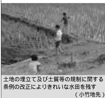
土地の埋立て及び土質等の規制に関する条例の改正によりきれいな水田を残す（小竹地先）

問 今定例会に「佐倉市土地の埋立て及び土質等の規制に関する条例の一部を改正する条例制定について」が上程されている。本条例の改正が行