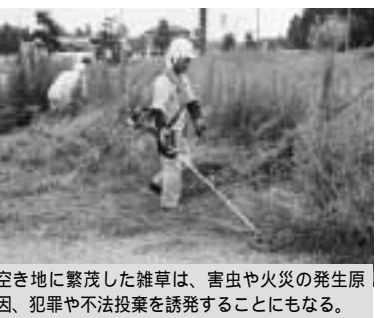
空き地に繁茂した雑草は、害虫や火災の発生原因、犯罪や不法投棄を誘発することにもなる。

問 住宅地域にある空き地の雑草等の処理を所有者が行わない場合、市はその者に対して雑草除去の勧告を行うことができるが、これに従わない場合、一定の手続きを踏むことにより市が直接措置できるようなするなど強制力のある条例に改正すべきではないか。